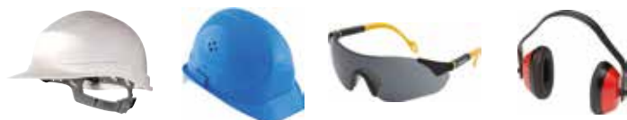
Industrijske zaštitne kacige, zaštitne naočale, zaštita sluha