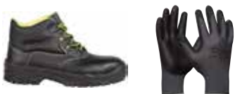
Zaštitne cipele, zaštitne rukavice