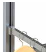
Regalni sustavi Stili